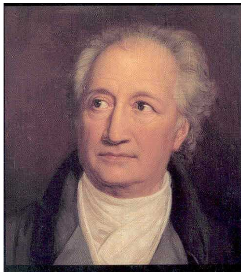
Иогáнн Вóльфганг фон Гёте (1749–1832)